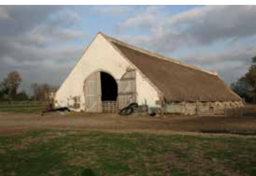
Bergerie de la Favouillane, novembre 2006.

Cet ouvrage fait partie d'une collection d'Atlas régionaux réalisés par INTERBEV, Association nationale interprofessionnelle du bétail et des viandes, créée en 1979 par les professionnels des secteurs bovin, ovin et équin afin de proposer aux consommateurs des produits sains, de qualité et identifiés tout au long de la filière. Au travers de ces Atlas, INTERBEV souhaite donner à tous les professionnels, élus, journalistes, enseignants qui le souhaitent, une clé de lecture positive de l'élevage et de ses filières dans chacune des principales régions d'élevage de France, ainsi que de présenter le bouquet de services que l'élevage rend sur le territoire. Dans une société où les consommateurs et citoyens sont de plus en plus urbains et où de nombreuses questions sur l'élevage et ses produits émergent, il est en effet utile d'analyser et de montrer les rôles et les dynamiques multiples de l'élevage pour comprendre son interaction avec les territoires. Systèmes d'élevage, métiers, savoir-faire, filières, produits fromagers et carnés, environnement et pratiques, paysages, identité culturelle et patrimoine sont ainsi abordés dans cet Atlas qui présente de nombreux schémas, graphiques, cartes et données chiffrées. L'Atlas de la Région Provence-Alpes-Côte d'Azur a été élaboré en étroite collaboration entre INTERBEV, le CERPAM, la Maison de la transhumance et la Maison Régionale de l'Elevage. Il est disponible en version papier et sous forme téléchargeable sur : www.interbev.fr/atlas .