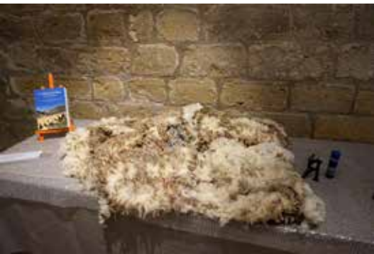
Toison mérinos d'Arles, Musée de l'Empéri, avril 2017.