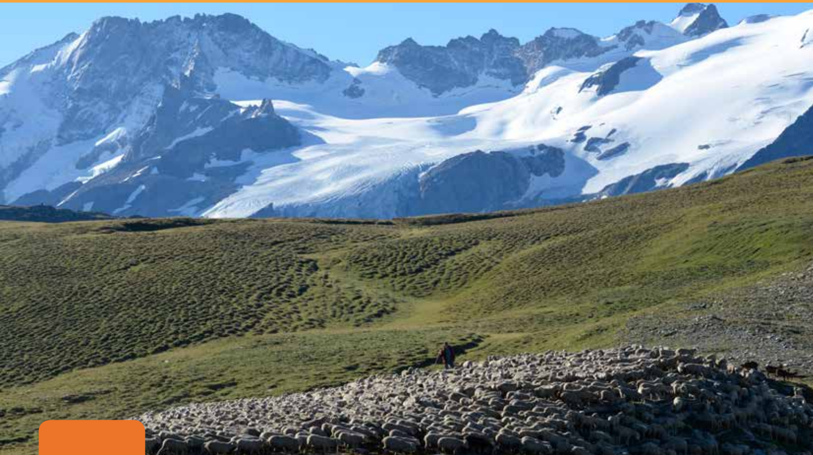
Raymond Hustache, alpage du Rif Tort, plateau d'Emparis, Parc national des Ecrins, août 2013.