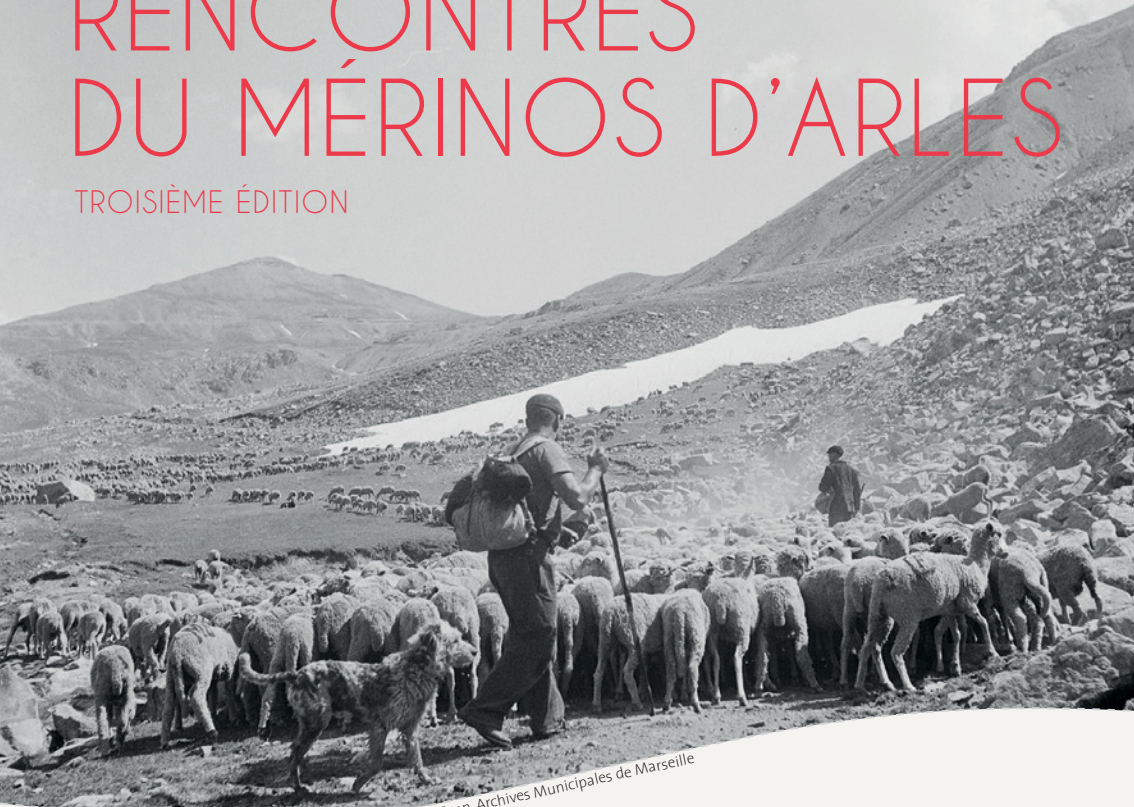
Transhumance du troupeau Chemin, 1951.

Samedi 18 novembre ► à partir de 16h LA TRANSHUMANCE AU PATRIMOINE CULTUREL IMMATÉRIEL DE L'HUMANITÉ ? CINÉ-CONCERT DRALHAS CHAPELLE DU MÉJAN