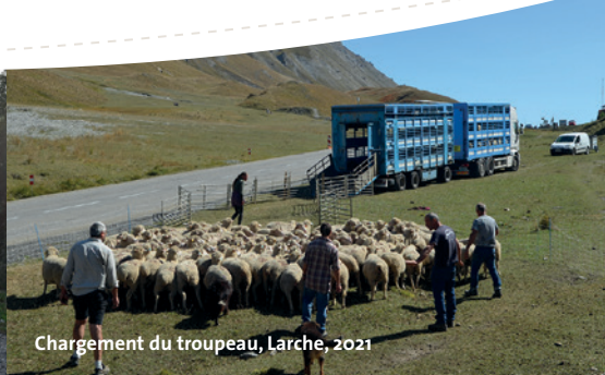
Chargement du troupeau, Larche, 2021