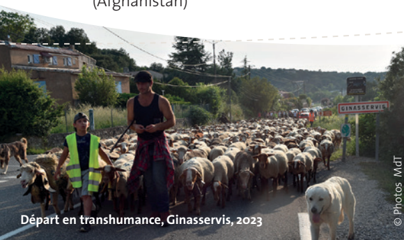
Départ en transhumance, Ginasservis, 2023