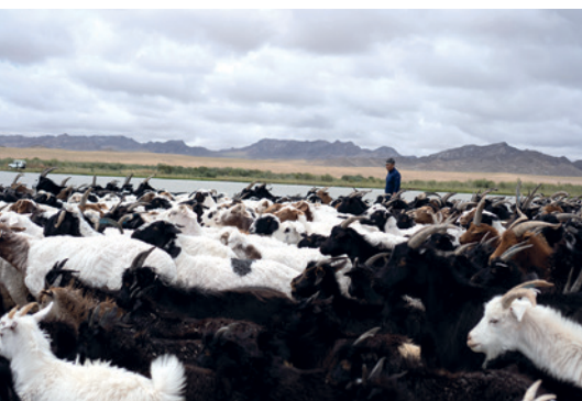
Troupeau de chèvre à cachemire dans la région de Zavkhan, Mongolie © Jean-Baptiste Truffaut.