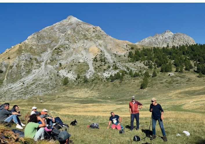
40 e Rencontre nationale des acteurs du pastoralisme, alpage des Chalets de l'Izoard, Hautes-Alpes, septembre 2025.