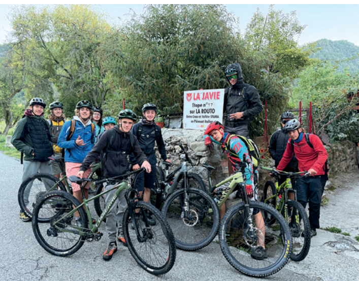
Élèves de Carmejane en séjour sur La Routo, La Javie, septembre 2025.