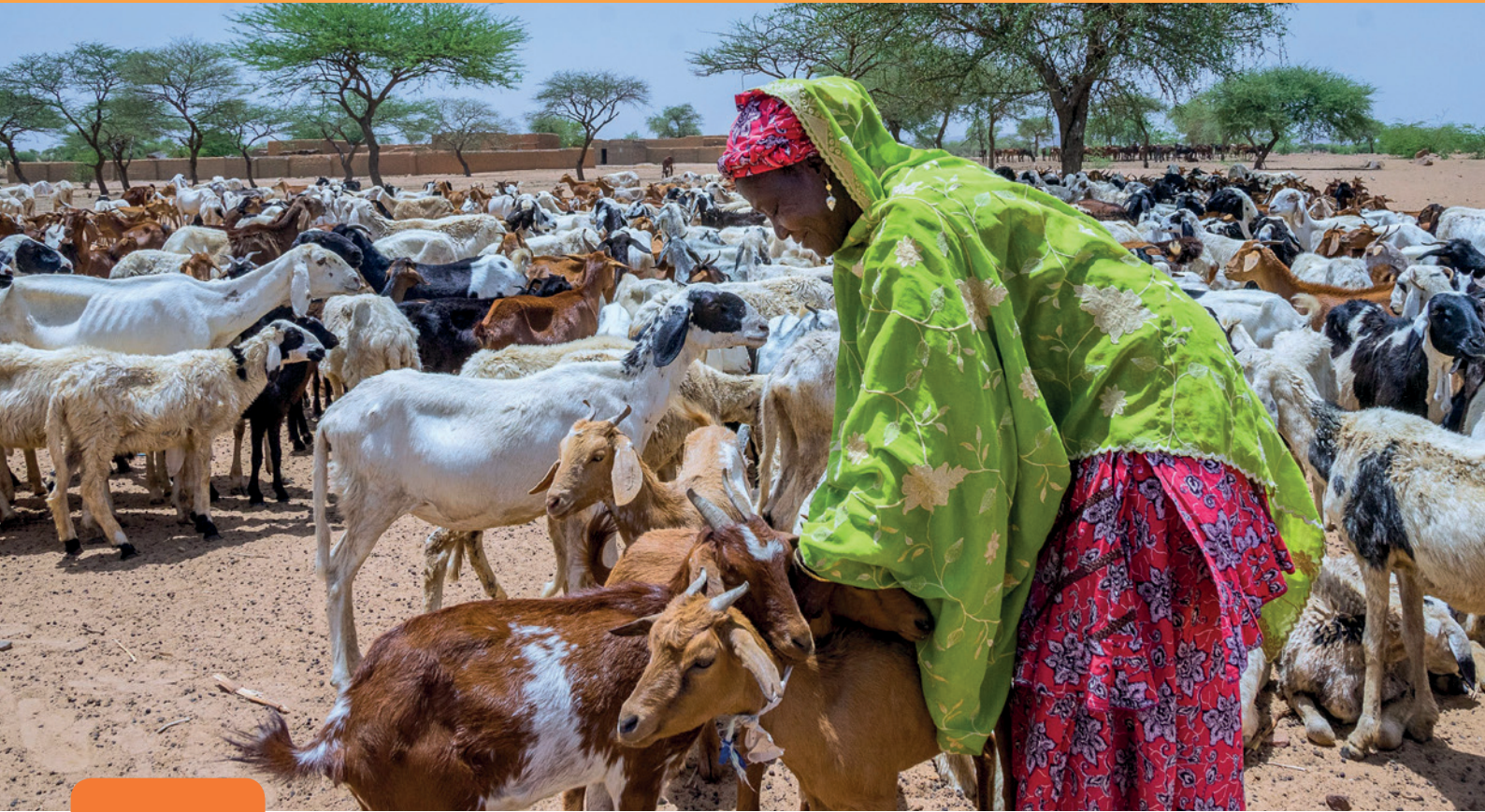
Une femme éleveuse au Niger © FAO/Andrew Esiebo.